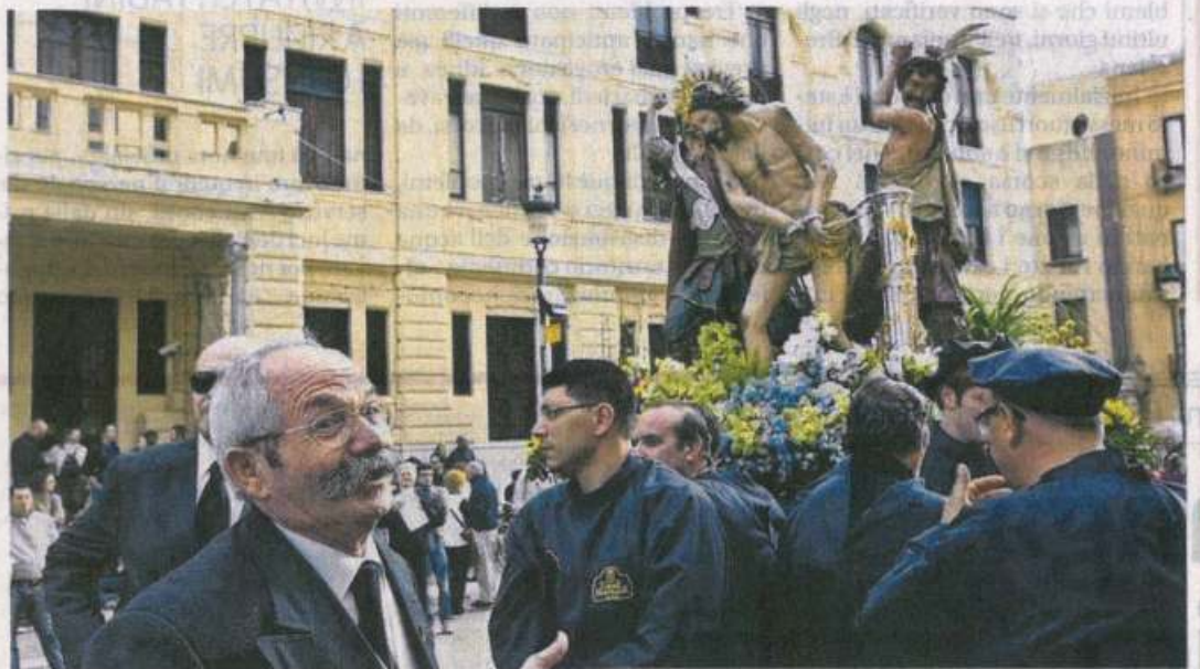
Un momento della processione dei misteri

●●● Ferve già la macchina organizzativa della Processione dei Misteri 2015, che si aprirà venerdì 3 aprile alle 15 e non alle 14, come consueto. È questa una delle recenti novità stabilite dall'assemblea dell'Unione Maestranze, che ha approvato, inoltre, il regolamento definitivo, l'itinerario in centro storico e il calendario delle Scinnute, la prima delle quali è prevista il 20 febbraio. Meno di un mese, quindi, per entrare nel vivo dell'atmosfera di una delle Processioni più attese in Sicilia. Prima che il portone della chiesa delle Anime Sante del Purgatorio schiuda i battenti, alle 13,30 alla chiesa di Santa Maria del Gesù in via Santa Elisabetta, si svolgerà la cerimonia della Discesa dalla Croce, alla quale sarà presente pure l'Unione Maestranze, che ha chiesto al Vescovo, Pietro Maria Fragnelli, di effettuare il mutamento di orario per consentire ai fedeli di partecipare a entrambe le cerimonie religiose. L'innovazione era stata caldeggiata durante la Processione dello scorso anno, dal cronista Wolly Cammareri e da Don Liborio Palmeri. L'omelia iniziale del Vescovo è stata posticipata all'arrivo del gruppo dell'Addo-